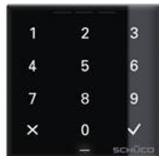
Schüco DCS Codetastatur

Anwendungsbeispiel für Schüco System DCS