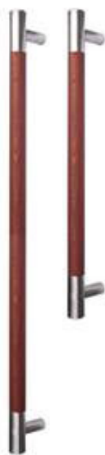
Rundgriff aus Jatobaholz Endstücke und Stützen (gerade) aus Edelstahl Längen: von 400 bis 1600 mm