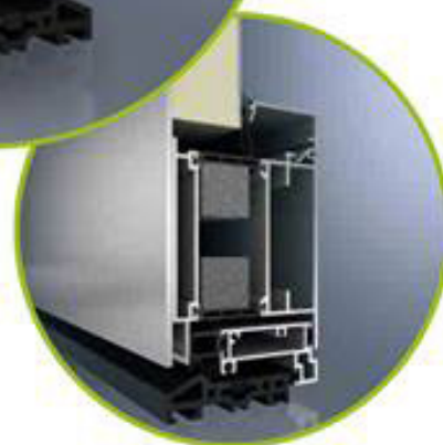
ADS 75.HI außen flügelüberdeckend

Anwendungsbeispiel für Schüco System (ADS 75.HI)