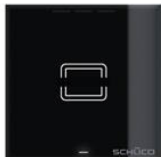
Schüco DCS Kartenleser