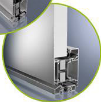
ADS 70.HI außen flügelüberdeckend

Anwendungsbeispiel für Schüco System (ADS 70.HI)