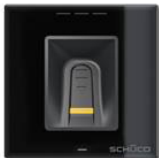
Schüco DCS Fingerprint