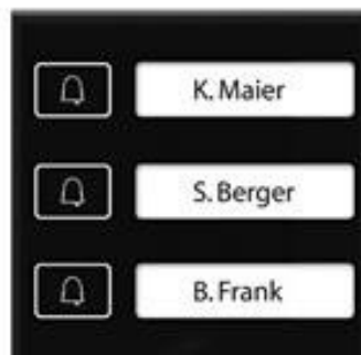
Schüco DCS Klingeltaster