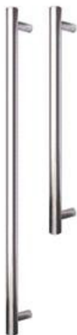
Rundgriff und Stützen (gerade oder schräg) aus Edelstahl, Längen: von 400 bis 1600 mm